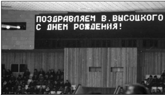
Поздравление Владимиру Высоцкому с Днём рождения. Северодонецк, Ледовый дворец спорта, 24 января 1978 года.

Не пил тогда – хотя сорокалетие его тогда было. Я помню, как во время концерта на электронном табло появилась надпись-поздравление с Днём рождения. Зал встал и очень долго аплодировал. Володя даже прослезился.